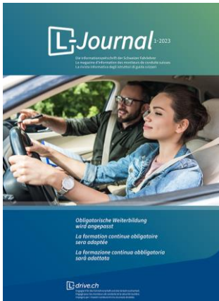
Cover der Ausgabe

Das L-Journal richtet sich nicht nur an die Mitglieder von L-drive Schweiz / Suisse / Svizzera, sondern auch an Behörden, Ämter und Fachorganisationen, die sich mit den Themen Fahrausbildung und Verkehrssicherheit befassen. Ausserdem gehen regelmässig Grossauflagen an sämtliche Fahrlehrerinnen und Fahrlehrer schweizweit.