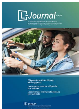
Cover der Ausgabe

Das L-Journal richtet sich nicht nur an die Mitglieder von L-drive Schweiz / Suisse / Svizzera, sondern auch an Behörden, Ämter und Fachorganisationen, die sich mit den Themen Fahrausbildung und Verkehrssicherheit befassen. Ausserdem gehen regelmässig Grossauflagen an sämtliche Fahrlehrerinnen und Fahrlehrer schweizweit.